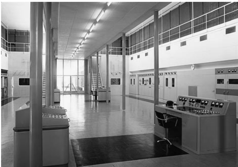
De bedieningszaal voor korte golf

Korte golf werd vanuit Huizen (zie de Rondstraler van november 2009) verplaatst naar Lopikerkapel. In 1949 werd in een aantal barakken op het terrein van Nozema werd begonnen met korte golf uitzendingen. In 1956 werd een nieuw HF-zendstation opgericht op de lokatie van de huidige zenderwijk in IJsselstein. Dit station is in de jaren '80 overgenomen door Flevoland. Sinds 2007 is ook Zeewolde gesloten. De zenders zijn daar ondertussen ook verwijderd. Ze zijn Duitsland en Engeland verhuisd en zijn nu daar in gebruik. Het zendergebouw van het kortegolf zendstation in IJsselstein is bewaard gebleven. Er zit een gemeenschapsruimte in. De hal is in zijn oorspronkelijke vorm bewaard. Aan weerszijden zijn er woningen tegen aangebouwd.