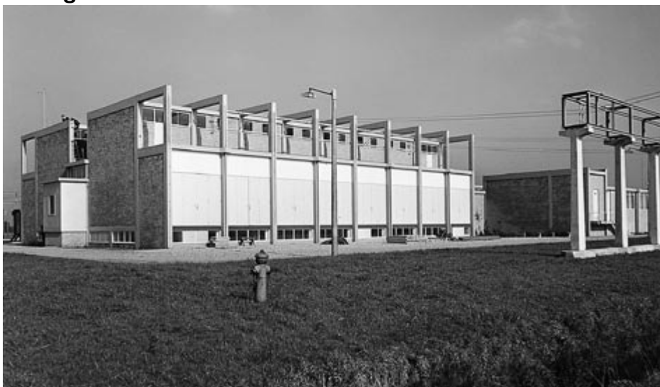
Foto: Het korte golf zendgebouw in IJsselstein

Korte golf werd vanuit Huizen (zie de Rondstraler van november 2009) verplaatst naar Lopikerkapel. In 1949 werd in een aantal barakken op het terrein van Nozema werd begonnen met korte golf uitzendingen. In 1956 werd een nieuw HF-zendstation opgericht op de lokatie van de huidige zenderwijk in IJsselstein. Dit station is in de jaren '80 overgenomen door Flevoland. Sinds 2007 is ook Zeewolde gesloten. De zenders zijn ondertussen verwijderd. De zenders zijn Duitsland en Engeland verhuisd en zijn nu daar in gebruik. Het zendergebouw van het kortegolf zendstation in IJsselstein is bewaard gebleven. Er zit een gemeenschapsruimte in. De hal is in zijn oorspronkelijke vorm bewaard gebleven en aan weerszijden zijn er woningen tegen aan gebouwd.